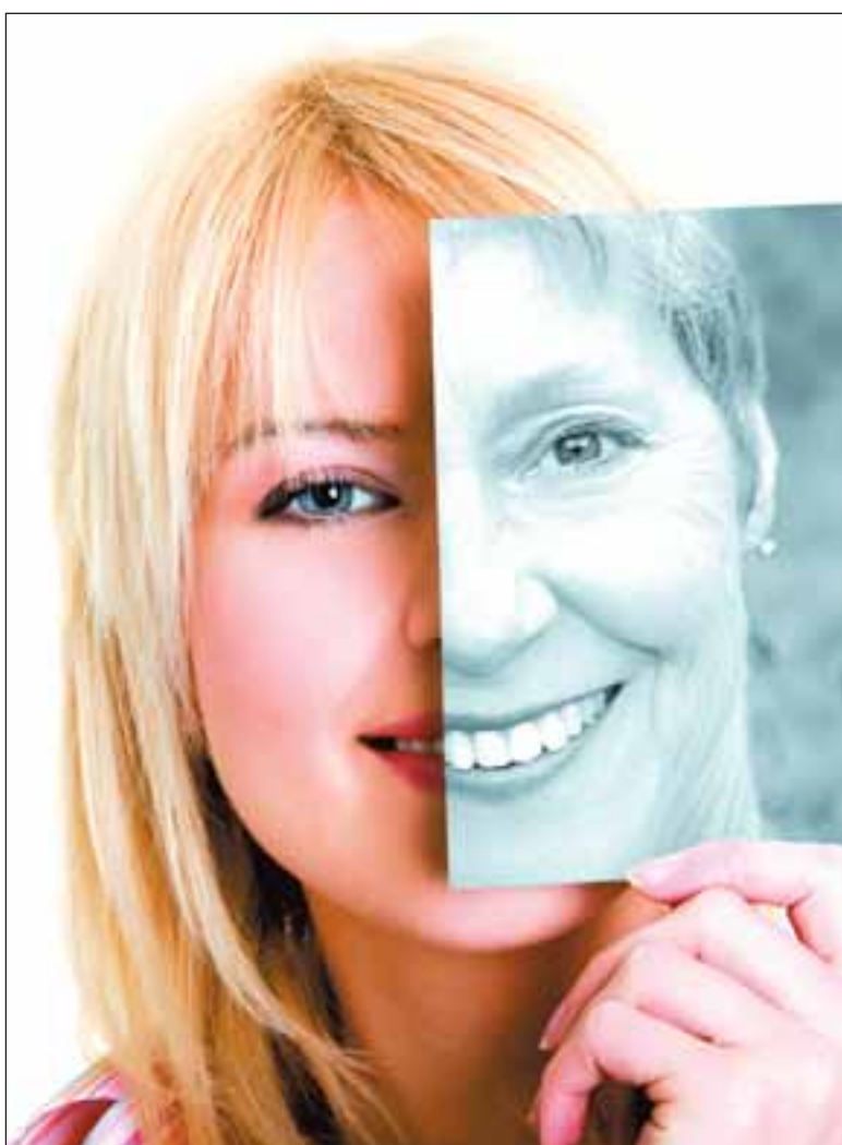
Wie sehe ich in 20 Jahren aus? An der Morphing Station, die Anfang Mai im VITA-CENTER steht, können die Besucher dieses Geheimnis lüften.