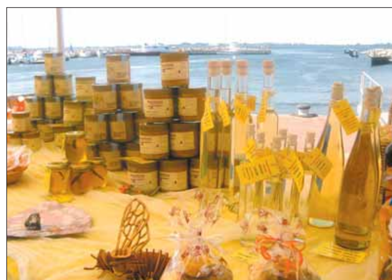
Hausgekelterter Met und Honiglikör gehören neben den selbsterzeugten und veredelten Honigprodukten zum Sortiment.