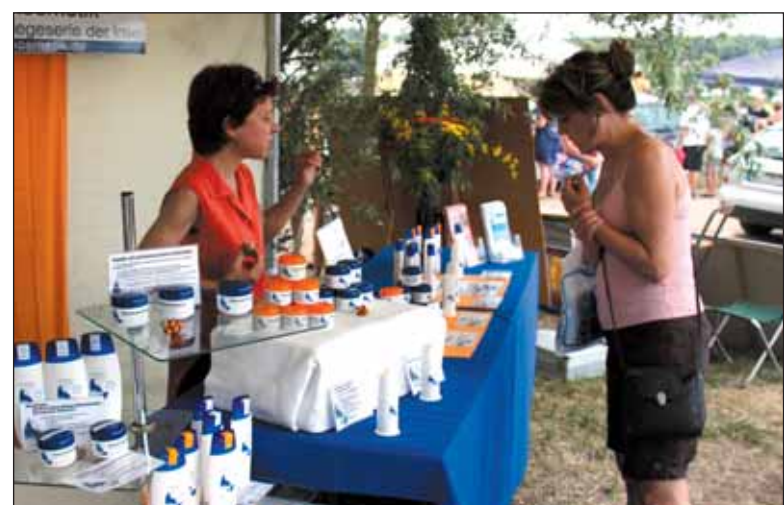
Rügen-Kosmetik setzt bei der Herstellung der Pflegeprodukte auf Stutenmilch und Heilkräuter auf eine sehr hohe Qualität.

1991 sollte die Haflingerzucht Ummanz „abgewickelt“ werden. Man suchte nach einem Ausweg, wollte die bekannte Pferdezucht erhalten. Ein Hautarzt und eine Apothekerin kamen auf die Idee, uraltes Wissen wieder nutzbar zu machen und die vielen positiven Eigenschaften der Stutenmilch als qualitativ hochwertige Hautpflegemittel und therapeutische Substanzen bei Hauterkrankungen zu nutzen. Unter ständiger Aufsicht des Veterinäramtes wird seitdem Vorzugsmilch gewonnen und zu Rügen-Kosmetik Produkten veredelt. Die Pferdezucht auf der Insel Ummanz, zwischen Rügen und Hiddensee gelegen, konnte so erhalten werden. Die Stuten umweht täglich die reine Ostseeluft. Sie grasen auf den gesunden Weiden mit saftigem und gehaltvollem Grün. Dadurch sind die Tiere gesund und entspannt, und die Stutenmilch hat einen optimalen Gehalt an den besonderen, wirksamen Inhaltsstoffen. Stutenmilch weist aufgrund der antibakteriellen und entzündungshemmenden Bestandteile, der Euterbeschaffenheit der Stuten deutlich weniger Keime auf als Kuhmilch. Außerdem enthält sie weniger allergieauslösende Stoffe. In der Zusammensetzung ist sie der menschlichen Muttermilch deutlich ähnlicher als Kuhmilch. 60 bis 70 Millionen Jahre lag die Rügener Heilkräuter unangetastet im