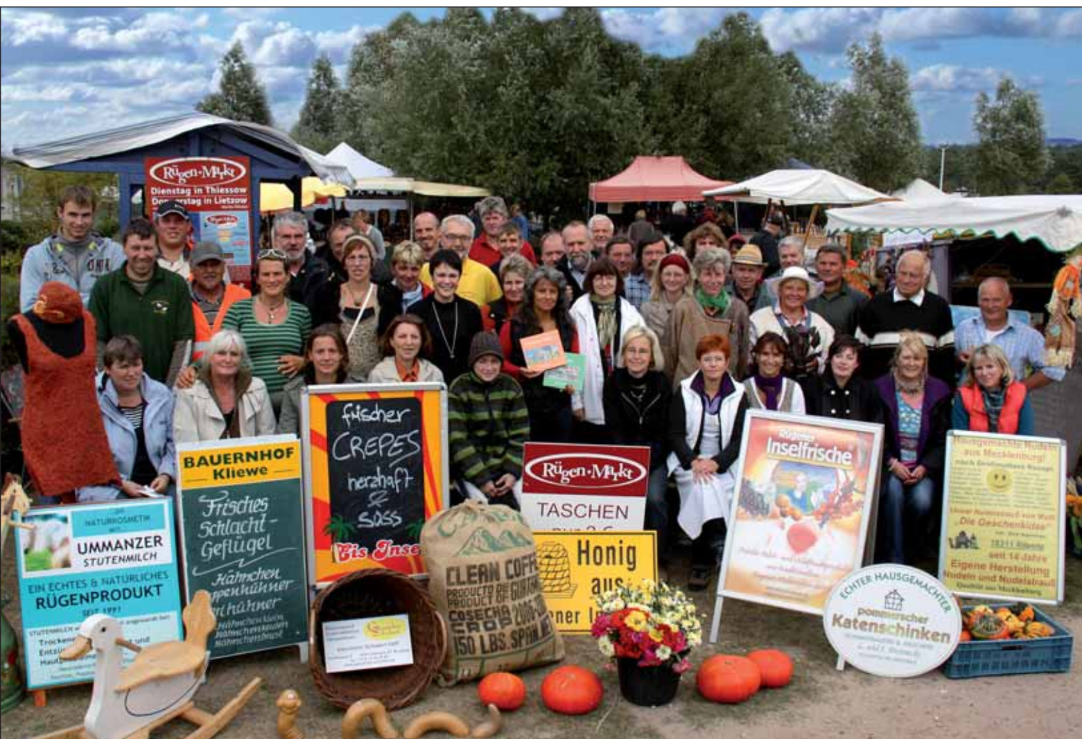
Die Kunsthandwerker und regionalen Produzenten von der Ostsee-Insel Rügen freuen sich ab 6. Februar auf die Besucher im VITA-CENTER. Es ist das erste Mal, dass der Rügen-Markt „on tour“ ist.

Rügen-Markt im Hafen des idyllischen Lotsendorfes Thiessow: Sehen, riechen, schmecken